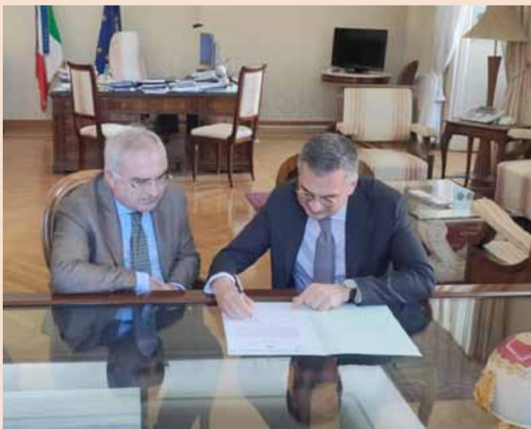
Firma protocollo d'intesa tra il Commissario Zes Campania Giuseppe Romano ed il Prefetto di Napoli Claudio Palomba

a creare un ecosistema industriale più integrato e efficiente, che possa attrarre investimenti significativi e creare nuove opportunità di occupazione. Un altro punto di forza della strategia di sviluppo della Campania è stata l'implementazione dello Sportello Unico Digitale, una piattaforma