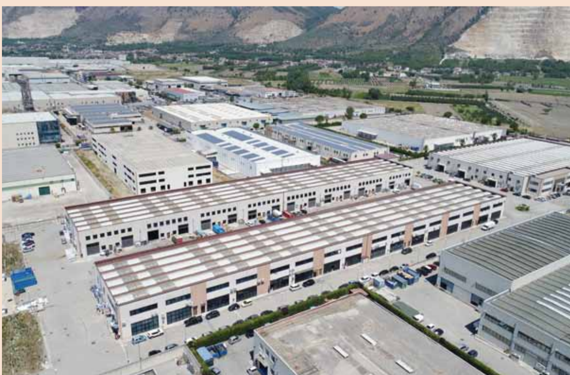
Interporto di Nola